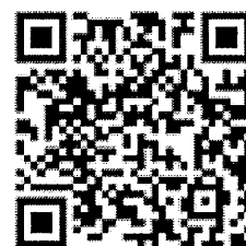
QR Code ลงทะเบียน