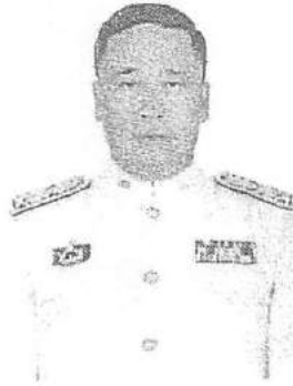
นายนภดล เทพพิทักษ์ อดีตเอกอัครราชทูต ณ เวียงจันทน์ สาธารณรัฐประชาธิปไตย ประชาชนลาว